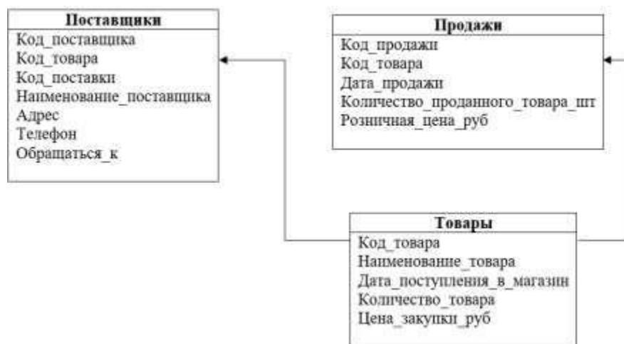
Рис.4. Вторая нормальная форма

Переменная отношения находится в третьей нормальной форме тогда и только тогда, когда она находится во второй нормальной форме, и отсутствуют транзитивные функциональные зависимости не ключевых атрибутов от ключевых (рис.5).