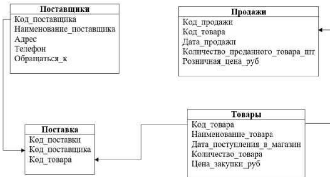
Рис.5. Третья нормальная форма

Переменная отношения находится в третьей нормальной форме тогда и только тогда, когда она находится во второй нормальной форме, и отсутствуют транзитивные функциональные зависимости не ключевых атрибутов от ключевых (рис.5).